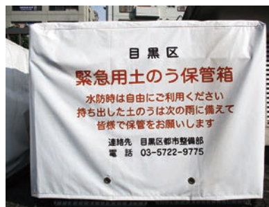
紧急时使用土沙袋保管箱