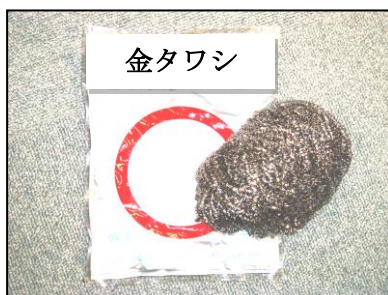
台所用ステンレスたわし （穴に詰めやすい）