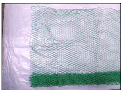
金網（はさみで切れる、 広めの隙間に向く）