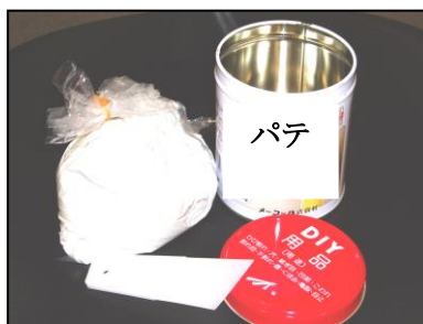
パテ・簡易セメント・モルタル・コーキング剤など （外壁などをきれいに仕上げたいときに）