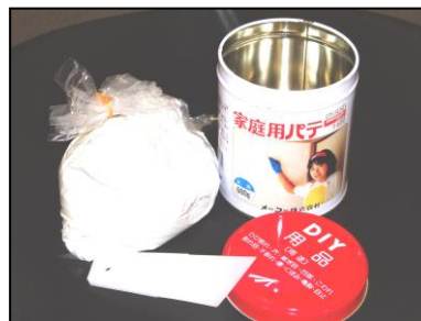
パテ・簡易セメント・モルタル・コーキング剤など （外壁などをきれいに仕上げたいときに）