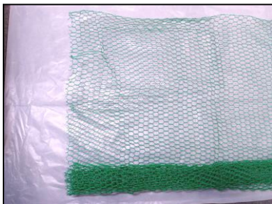
金網（はさみで切れる、 広めの隙間に向く）