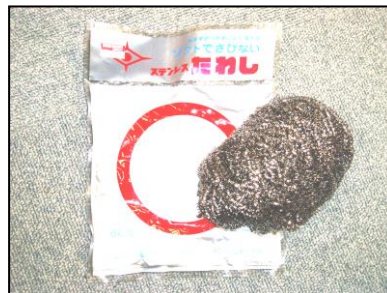
台所用ステンレスたわし （穴に詰めやすい）