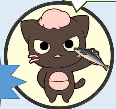
目黒区商店街連合会 スマにゃん