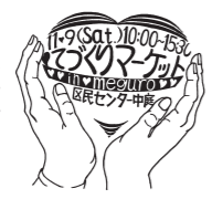
てづくりマーケット商品の一例

自然素材で手作りしたこだわりの品が勢ぞろい。作り手と買い手をつなぐこのマーケットで、あなたのお気に入りを見つけてください。