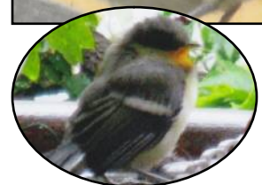
(上)五本木 1 丁目通信員 (下)自然通信員