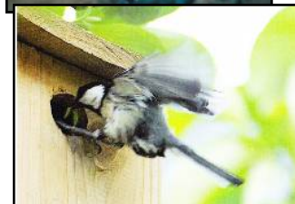
(上)原町 2 丁目通信員 (下)祐天寺 2 丁目通信員

5月10日。昨年も同じ時期に巣箱の中からチチィとひなの声が聞こえ、2羽の親鳥が巣箱にエサを運んでいましたが、巣立ったところは見られませんでした。今年も同様です(緑が丘2丁目通信員) 4月6日、巣箱2つを6メートルくらいはなしてかけていたら、2羽ずつが別々の箱に巣作りをはじめ抱卵、5月24日、9羽+5羽のひながつまれとびたって行きました(青葉台2丁目通信員) 7月9日、連日のようににぎやかな巣箱、朝5時頃から5時45分までに全員巣立ちました(目黒本町2丁目通信員) 4月6日、巣作り開始、一番底は土や樹の幹の苔、その上に雑草や細い木の枝、一番上は羽毛でおおわれていた。5月24日、今年もシジュウカラの雛が8羽巣立っていきました(原町2丁目通信員) 5月13日、9時過ぎから7羽のヒナが巣箱から飛び出して行きました。思ったよりずっと上手に飛べてびっくりしました。今は無事に巣立ってくれた喜びと、居なくなった寂しさを感じています(五本木1丁目通信員) 2012年の結果はただいま集計中です。