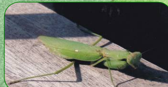
10月31日 ハラビロカマキリ 2階のベランダで日なたぼっこ。 たびたび出てきてここが気に入っ ているよう(原町2丁目通信員)