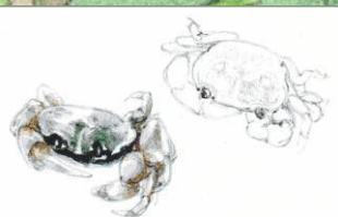
10月20日 サワガニ 目黒不動独鈷 の滝まわりから(下目黒4丁目通信員)