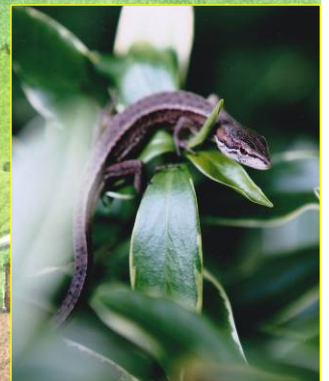
6月15日 カナヘビ 沈丁花 の葉の上で日光浴をしていた (自然通信員)