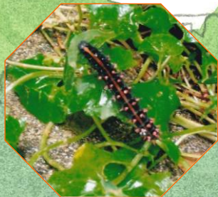
9月6日 ツマグロヒョウモン の幼虫 葉上に3匹見つけた(柿 の木坂1丁目通信員)