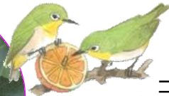
冬はくちばし が黄色になる