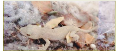
12月31日 ヤモリ 車庫 の隅の綿ぼこりの中で発見 (原町1丁目通信員)