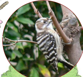
2月6日 コゲラ 木にとまって つづいていた(自然通信員)