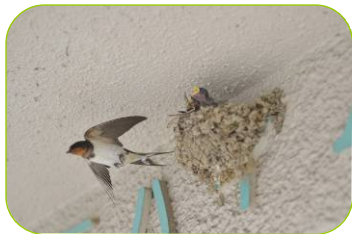
ツバメの巣（緑が丘）