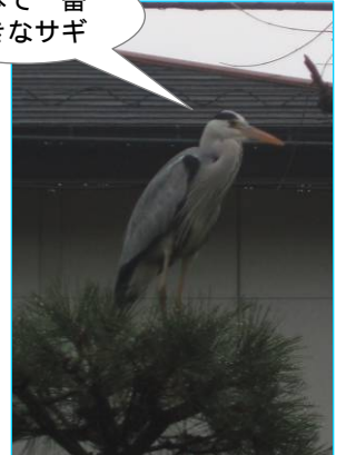
1月9日 アオサギ 松の木にとまる (中町1丁目通信員)