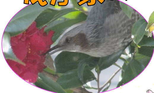
2月21日 ヒヨドリ 八重樫の花びらを食べている (下目黒4丁目通信員)