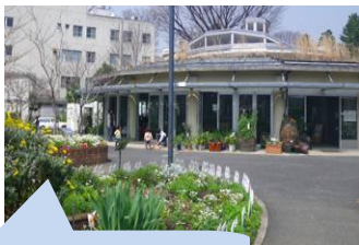
水仙が咲き出しました

有機・無農薬の園芸を実践・紹介し、ボランティアのみなさんと一緒に、生きものと共生できる公園づくりを行っています。