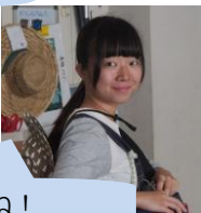
生きものや植物のこと、気軽に聞いてね！