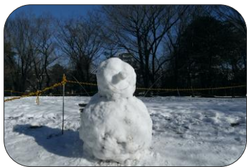
目黒の風物詩 駒場野公園の雪達磨