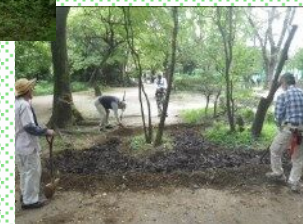
カリンの根回り養生