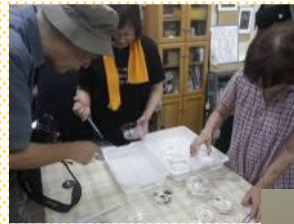
ホタルの幼虫のお世話