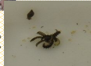
餌のモノアラガイを食べる ホタルの幼虫たち