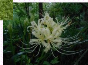
白花の ヒガンバナ