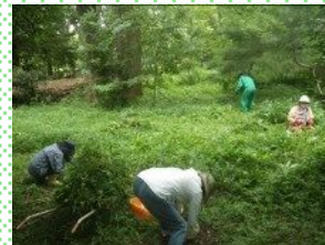
雑木林の下草刈り