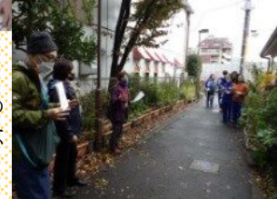
国際高校への 課外授業対応