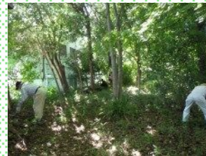
雑木林の下草刈り