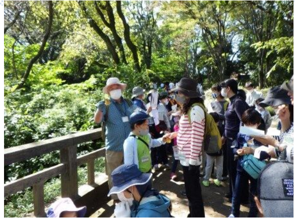
駒場野公園にはいくつか桜の種類があります。その種類の見分け方を教えてくれました。