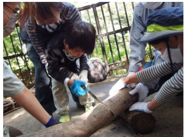
初めてのノコギリ体験！慣れない手つきだったけど、みんなで協力して太い木の枝が切れたよ！