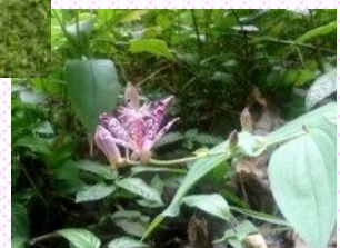
ヤマホトギスが 花盛り