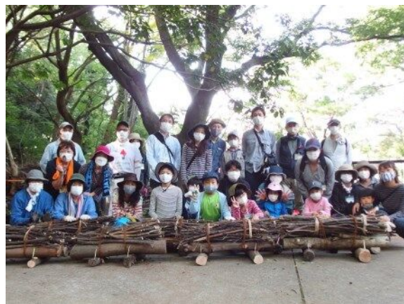
皆の協力で素敵な柵が出来上がりました！完成した柵と一緒に記念撮影！