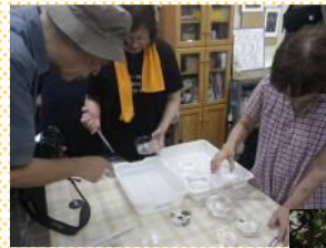
ホタルの幼虫のお世話