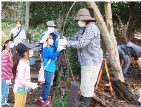
自分の背丈よりも長い木の枝を材料！頑張って運んで作業の準備を整えたよ！

午前中に学んだ公園の桜を守るため、傷んだ根を養生するための柵を作ったよ。慣れない道具に戸惑ったりもしたけれど、最後には素敵な柵が出来上がりました！