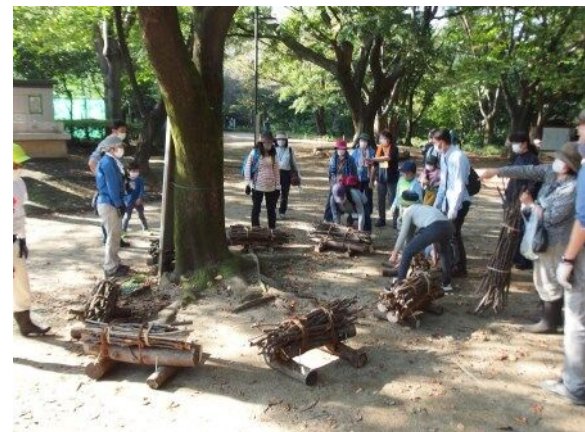
最後は傷んだサクラの根を保護するように並べたよ。この柵で桜が元気になるといいね！