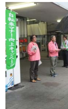
押しちゃりキャンペーン風景