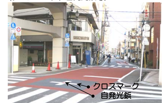
写真：唐ヶ崎通り鉄道高架下の整備後の状況