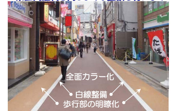
写真：東西商店街の整備後の状況