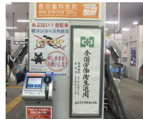
押しちゃり啓発ちらし