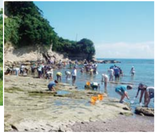
自然宿泊体験教室(磯観察:興津)