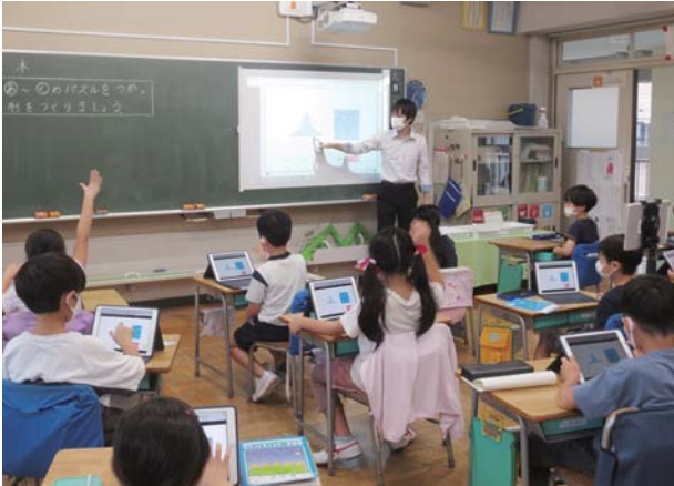
教育現場のデジタル化