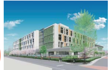
東山小学校外観図