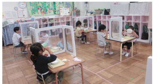
飛沫防止対策を講じた給食の様子