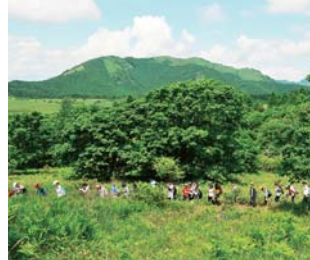
自然宿泊体験教室(登山:八ヶ岳)