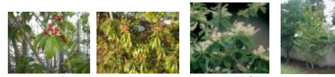
ソヨゴ アセビ リョウブ ナツツバキ

雑木を主体とした散策を楽しめる植栽で、明るく開放的な花の広場と木陰を楽しむ雑木のトンネルがあるエリア。