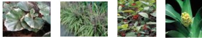
フィリツワブキ フィリヤブラン ヤブコウジ オモト

景石や陶板で特徴づけた枯山水と、日陰に耐え、葉色の美しい斑入りの地被植栽を主体とし明るいイメージを演出したエリア。