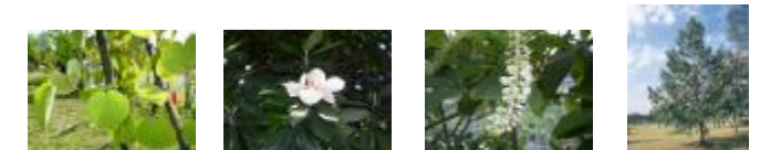
カツラ タイサンボク シマトネリコ ハンノキ

巨大な壁に囲まれた敷地のため、上空に伸びる樹形の美しい樹木、カツラを主木として広場から見える構造物の修景を図ったエリア。