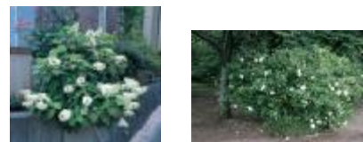
カシワバアジサイ クチナン