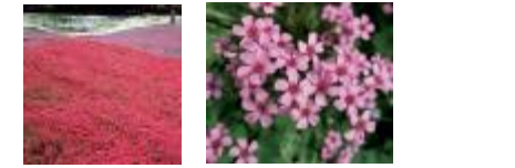
シバザクラ イモカタバミ

四季の移ろいと変化を楽しめる植栽で、花の香りが漂うように北から南に花の段々畑があるエリア。