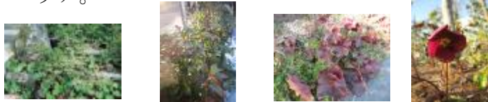
ユキノシタ セイヨウイワナンテン ヒューケラ クリスマスローズ

勾配や段差を活かした信楽焼きの縁石等で植栽帯を設け、日陰に耐える地被植栽が混植されているエリア。