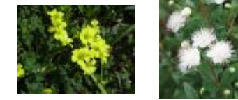
オキザリス ギンバイカ