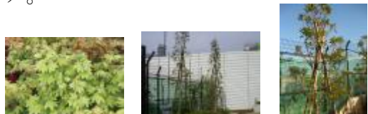
コハウチワカエデ 常緑ヤマボウシ ヒメユズリハ

集いの広場に心地よい緑陰をもたらす樹木として紅葉の美しいコハウチワカエデを主木とし、また香りがある低木植栽が来園者を迎えるエリア。