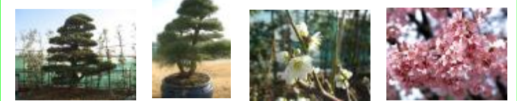
ゴヨウマツ クロマツ ウメ サクラ

四阿周辺の伝統的な日本庭園の植栽、くつろぎの芝生広場、つづら折り園路の混植植栽、信楽焼きの大鉢に植えられた仕立物のクロマツなど、多様な景観が楽しめるエリア。