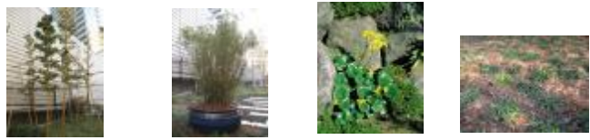
キンメイモウソウ ホウオウチク ツワブキ タマリユウ